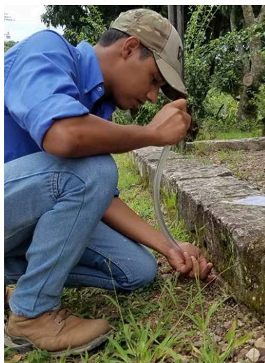
Figura 1. Método de recolección de una colmena silvestre en Escuela Agrícola Panamericana, Zamorano.

La especie evaluada fue Tetragonisca angustula , se recolectaron abejas pecoreadoras de polen y néctar de colmenas silvestres encontradas en el campus de la Escuela Agrícola Panamericana, Zamorano. Las abejas fueron colectadas en la piquera de la colmena con el uso de un fragmento de manguera, aspirando una a una las abejas que iban saliendo y transfiriendo cinco abejas por cada jaula.