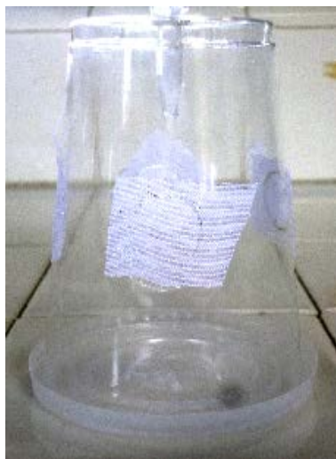
Figura 2. Modelo de jaula obtenido del libro de Dietman et al. (2013) y Díaz (2015).