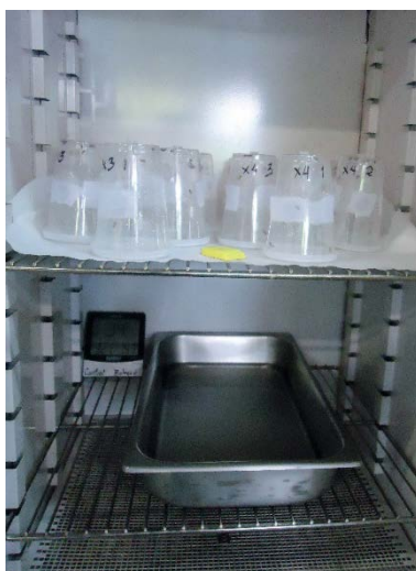
Figura 4. Jaulas con abejas postaplicación en incubación en el Laboratorio de Biotecnología y Fitomejoramiento.

Las abejas después de ser colectadas y transferidas a las jaulas se mantuvieron por 0.5 h en una incubadora como adaptación antes de la aplicación. Posterior a la aplicación se introdujeron nuevamente en la incubadora a una temperatura constante de 33.5 °C, una humedad relativa mayor al 50% (por medio de una bandeja con agua), y oscuridad total, simulando las condiciones internas de una colmena.