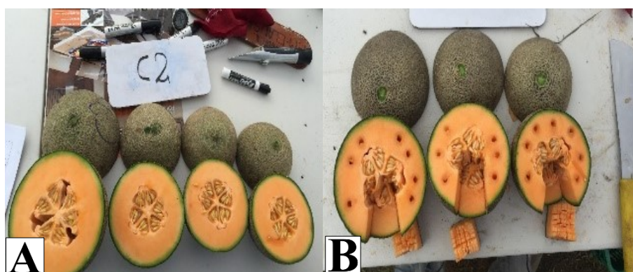
Figura 7. La calidad interna de la fruta se determina por la dureza de la pulpa, cavidad interna y grosor de pulpa. A) Calidad interna del híbrido HB2. B) Toma de datos de calidad interna de frutos (marcas por penetrometro y tajada para medir grados Brix).