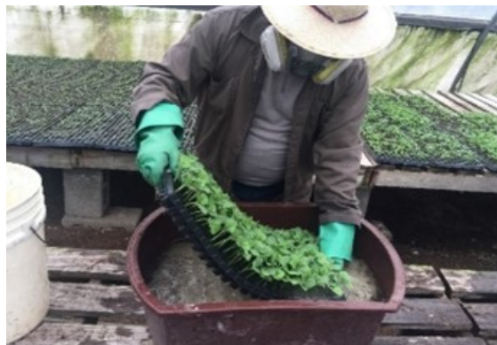
Figura 3. Tratamiento de plántulas con insecticidas y fungicidas en bandeja, por método de inmersión.

Para el mejor desempeño de las plántulas y aislarlas del ataque de plagas y enfermedades, se utilizó Agribon ® (Figura 4), una manta no tejida, esta fue colocada de manera que simulara un micro túnel. Las empresas dedicadas a la producción sugieren mantener esta cobertura por un tiempo de 21-22 DDT (días después de trasplante), se puede utilizar como punto de referencia el inicio de la floración o cuando el material vegetativo llene el micro túnel (Varela 2017).