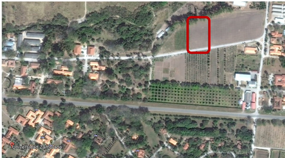
Figura 1. Ubicación del estudio área conocida como Parcelas, Escuela Agrícola Panamericana, Zamorano.

La investigación se realizó en el lote destinado para la realización del laboratorio de campo de la clase de Producción Vegetal, en la Escuela Agrícola Panamericana, Zamorano, Valle del Yeguaré, Municipio San Antonio de Oriente, Tegucigalpa, Honduras. Se encuentra en las coordenadas 14.010908N y -87.001563W. Este estudio se estableció en el ciclo de producción de marzo a junio del 2018 en un área de 1,653 metros cuadrados.