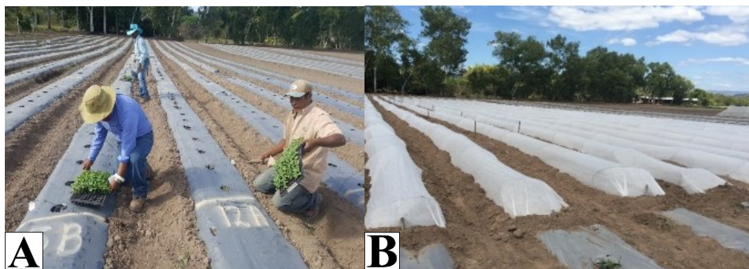
Figura 4. Trasplante de plántulas en parcelas asignadas según híbrido y tratamiento. A) actividades de trasplante. B) Armado de micro túnel con Agribon® para aislar las plantas del daño de plagas.