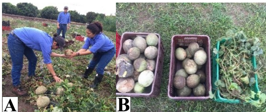
Figura 6. Actividades durante la cosecha al 75 DDT. A) Cosecha de Frutos y dos plantas representativas en relación a biomasa. B) Selección de frutos comerciales, no comerciales y biomasa para la correspondiente toma de datos de pesos y parámetros de calidad de melón.