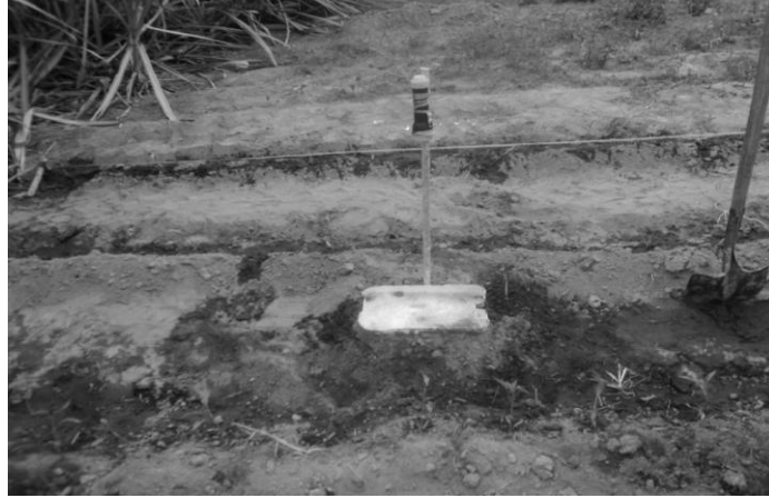
Anexo 1. Tratamiento físico - mecánico.