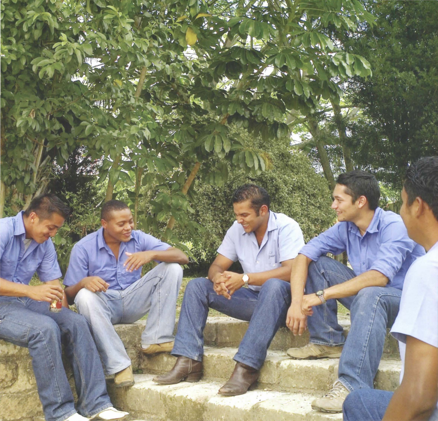
Estudiantes tomando un descanso entre clases.