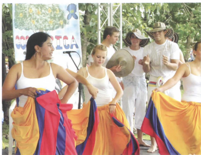
Cada otoño en la Fiesta Panamericana, los estudiantes de Zamorano presentan danzas folclóricas, cantos, y obras cortas para celebrar a sus países de origen y dar una muestra multi-cultural de su comunidad estudiantil.