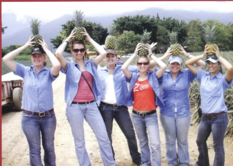
En 2008, el Programa de Verano de Zamorano les dio la bienvenida a once estudiantes norteamericanos de cuatro universidades de los EE.UU.

Cada verano, Zamorano da la bienvenida a estudiantes internacionales para un programa de estudio de diez semanas, en el que participan aproximadamente 10 a 15 estudiantes de pregrado, representando a universidades, sobre todo de EE.UU., que incluyen Cornell, Purdue, Texas A&M, y las universidades de Florida, Georgia, e Illinois. Desde mediados de mayo hasta principios de julio, los alumnos visitantes viven en el campus, asisten a clases, y participan de las experiencias prácticas de Aprender Haciendo de Zamorano, de acuerdo a sus intereses y áreas de estudio. Se ofrece también un curso opcional de Español intensivo, previo al programa, al final del cual cada estudiante tiene la opción de pasar una semana adicional como acompañante observador del trabajo de un voluntario de los Cuerpos de Paz.