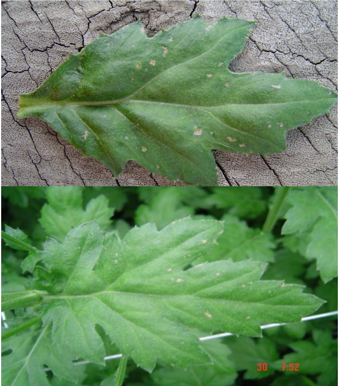
Anexo 1. Sintomatología de puntos necróticos en Crisantemo tipo pompón en la variedad Yellow Vero, Cultivos San Nicolás, Colombia, 2005.