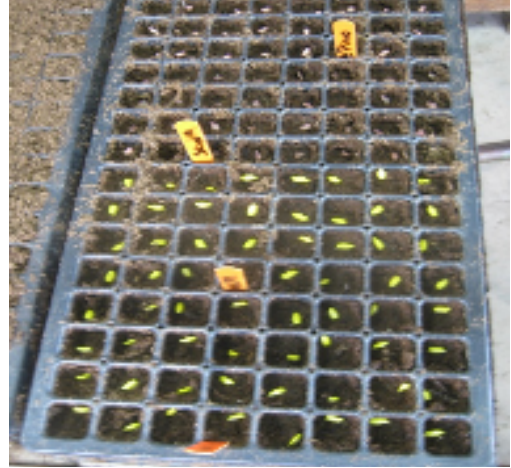
2. Bandeja llena de semillas