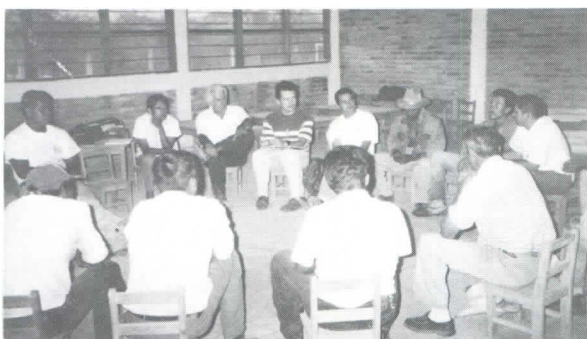
Reunión inicial entre agricultores y profesores de Zamorano.

Con el involucramiento del Departamento de Agronomía se inició un proyecto con los 16 pequeños productores de granos básicos en la aldea de Lizapa. Lizapa está localizada a unos 15 minutos de Zamorano en la carretera a Guinope. El Proyecto es dirigido a la asistencia crediticia y técnica en un proceso participativo. Coparticipa el Departamento de Economía agrícola en la parte del manejo del crédito.