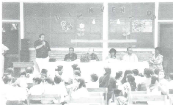
Miembros de Zamorano y alumnos de la escuela de San Francisco en la inauguración del servicio eléctrico.