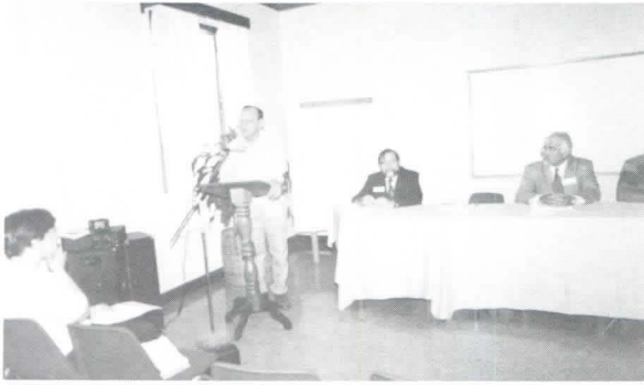
Miembros de la facultad de Zamorano e invitados del Gobierno de Honduras y ONGs.

sobre logros, dificultades, evaluación y seguimiento de su quehacer.