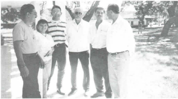
Tres de los Alcaldes de la Región y miembros de Unir.

En el mes de febrero se llevó a cabo un Taller de Manejo de Conflictos para los alcaldes y candidatos a alcaldes de la región del Yeguaré ( los municipios de San Antonio de Oriente, Tatumbla, Maraita,