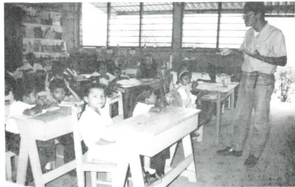
Estudiante zamorano impartiendo clase sobre medio ambiente en escuela rural.

estudio. Trabajaron en las comunidades, en la Apreciación Rural Participativa, utilizando instrumentos como juego sociológico, croquis comunitario, calendario de actividades y otros instrumentos participativos. Cada uno elaboró un informe de su trabajo he aquí algunos comentarios.