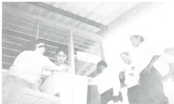
Alumnos participando en devolución de información en Rancho el Obispo, Yúscarán.

En todas las comunidades ha quedado seleccionado un grupo de sus miembros para servir de enlace con Zamorano. Participarán en los talleres de motivación con el compromiso de lograr el efecto multiplicador de los conocimientos adquiridos. Los integrantes de este grupo fueron electos en la asamblea comunitaria por todos los asistentes