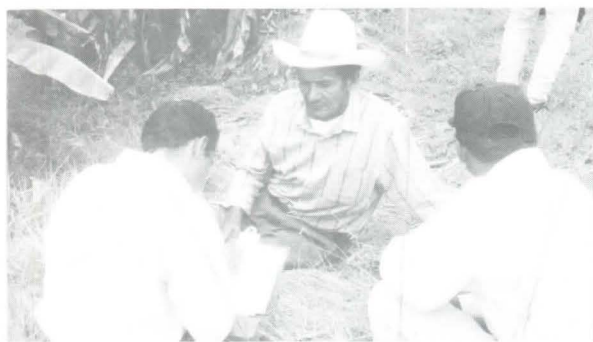
Agricultores investigadores y técnico en la redacción de informe en Tabla Grande.

En las comunidades de Tabla Grande en el municipio de San Antonio de Oriente y Lavanderos en el municipio de Guinope se organizaron dos CIAL. Con los que se llevó a cabo un trabajo de investigación en los cultivos de maíz y frijol a fin de encontrar una o dos variedades que se adapten a las condiciones de la comunidad. Los resultados de ensayos de prueba, dos de frijol y uno de maíz, ya se presentaron a cada una de las comunidades.