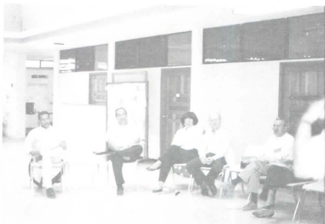
Miembros de la facultad de Zamorano.

El día 7 de marzo de 1997 se llevó a cabo un Taller de Reflexión sobre el Programa de Desarrollo del Yeguaré