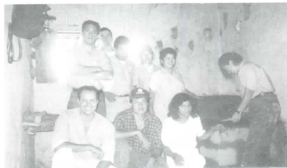
Estudiantes e instructores en Tatumbla.

Se iniciaron actividades conjuntas con el Departamento de Desarrollo Rural trabajando en algunas comunidades del municipio de San Antonio de Oriente, específicamente en la fabricación de estufas Lorena y algunos proyectos comunales, estas experiencias servirán de laboratorio para los estudiantes que participan en el macromódulo de Desarrollo Rural.