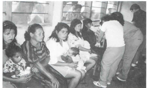
Brigada atendiendo pacientes en Tabla Grande.

Como una proyección de Zamorano, se ha brindado apoyo logístico a las brigadas médicas que envía la Soberana Orden de Malta, se inicia el apoyo con la selección de comunidades con mayor necesidad, promoción de la actividad, transporte y asignación de recursos humanos para la ejecución.