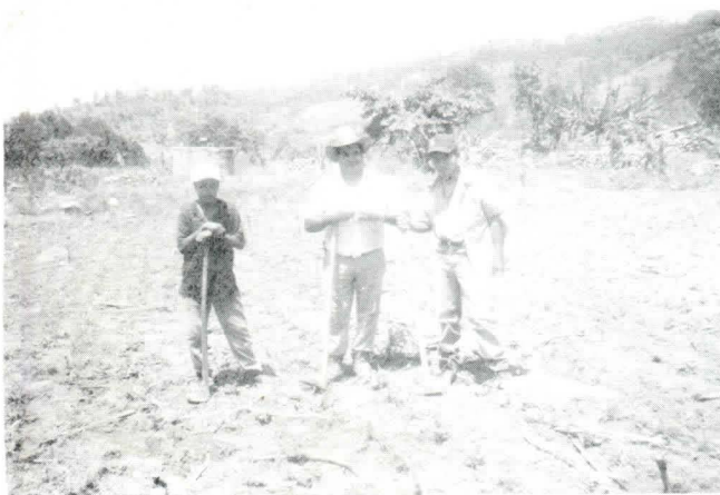
Estudiante trabajando en labores de campo con agricultor y su familia

El objetivo de esta actividad es de exponer al estudiante a la realidad rural y formar así profesionales concientizados en problemática rural. En las vacaciones de diciembre participaron 14 estudiantes de Zamorano, de diferentes países y diferentes años de