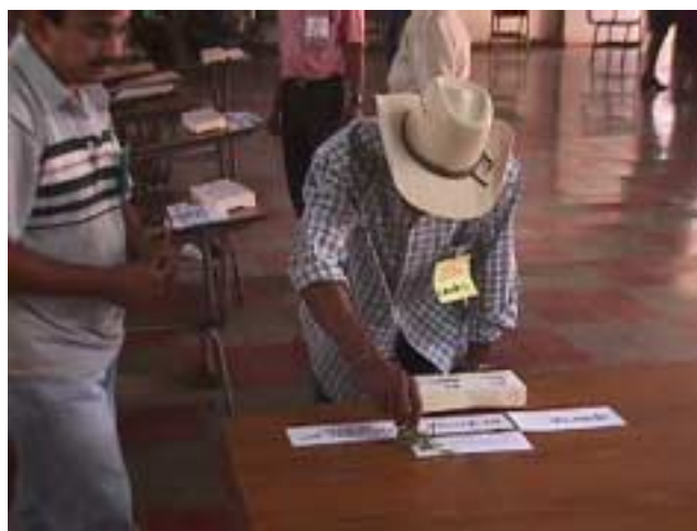
Figura 5. Productor observando la pregunta y las diferentes respuestas de la prueba de caja.

En las figuras 4 y 5 se puede observar la herramienta de la prueba de caja y su metodología.