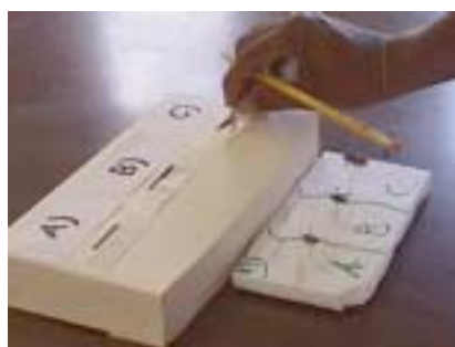
Figura 4. Caja donde se colocan las Respuestas en la prueba de conocimientos

Al tener listas las preguntas en sus estaciones, las cuales pueden ser colocadas en sillas o mesas donde se pone un cartón o papel con la pregunta, abajo las tres posibles respuestas (ya sean los especímenes o dibujos) con selección de a, b, ó c, abajo se colocará una caja con 3 orificios con la misma selección (a, b, o c) y para contestar la respuesta se les entregará una tira de cartón de la que colocarán un pedazo en la respuesta que ellos creen correcta. Se les dará un tiempo máximo de aproximadamente un minuto para contestar y se rotará en un mismo sentido hasta llegar de nuevo al sitio donde se inició. Ver Figura 4 y 5.