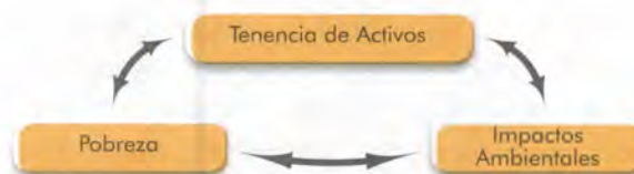
Figura 1: Relación pobreza, tenencia de activos e impactos ambientales

Es así que se crean mecanismos para entender la dinámica entre pobreza y medio ambiente de las comunidades, de esta manera Reardon y Vosti (1997; citado por Bahamondes, 2000) distinguen diferentes tipos de pobreza de acuerdo a categorías de posesiones y medio ambiente, con lo que demuestran que esta relación entre pobreza y medio ambiente difiere dependiendo de la composición de las posesiones de los hogares en zonas rurales. Según Munk (2002) los conceptos locales –no las apreciaciones externas– sirven de base para desarrollar perfiles de pobreza de mayor amplitud, donde la técnica aplicada para identificar las percepciones locales de la pobreza se basa esencialmente en la habilidad que tienen personas locales para clasificar a las familias vecinas en categorías de diferentes niveles de pobreza o de bienestar.