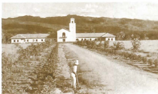
Edificio Zemurray, circa 1944

Zamorano ha crecido y cambiado en los últimos 67 años, esforzándose siempre por convertirse en una mejor institución, incluso aún más capaz y dispuesta a responder a sus estudiantes y a la gran comunidad Latinoamericana. En 1983 se graduaron las primeras mujeres de la Escuela, y desde entonces las mujeres han aumentado hasta representar una tercera parte