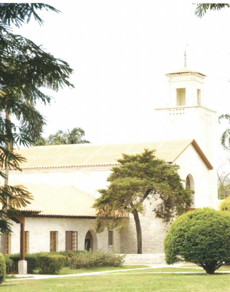
Edificio Zemurray, 2008

BIBLIOTECA WILSON POIRRO ESCUELA AGRICOLA PANAMERICANA DEPARTADO DE FRANCISCO MORAZAN, HONDURAS