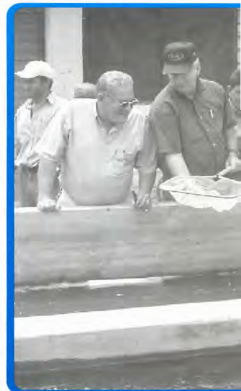
Productores y extencionistas del Programa durante su curso de capacitación en las insta

Los voluntarios del Cuerpo de Paz han ofrecido participar en la recolección de información para la base de datos de productores de tilapia en Honduras.