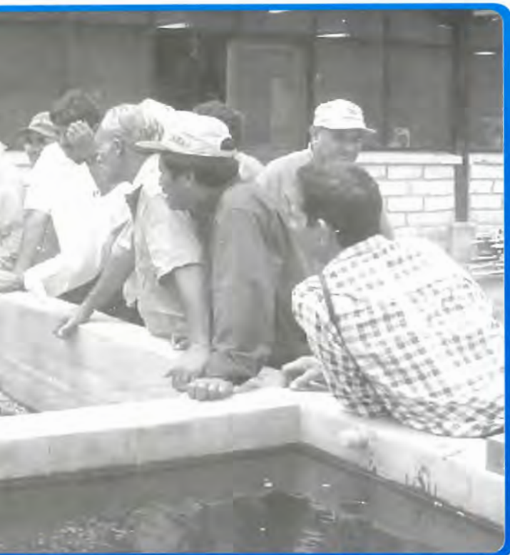
Reconstrucción Rural (PRR) en la estación acuícola del Zamorano.