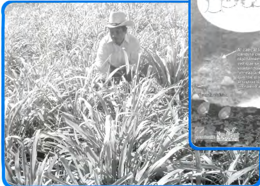
Productor evaluando crecimiento del lote experimental de pasto en el área de Nacaome.

Se produjeron cuatro afiches con mensajes de motivación y reflexión sobre los sistemas ecológicos de la región. Los afiches sobre el sistema de mangle rojo, playa rocosa, playa arenosa, y campaña de limpieza, forman conciencia sobre la importancia de mantener limpias y saludables las costas y sus ecosistemas. Estos afiches son distribuidos en las escuelas, lugares públicos y negocios locales. Un efecto de estas actividades es que el día 9 de noviembre la ciudad de San Lorenzo, liderada por los maestros, niños de escuela y un estudiante del Centro Universitario Regional del Litoral Pacífico, realizaron una campaña de limpieza en la ciudad.