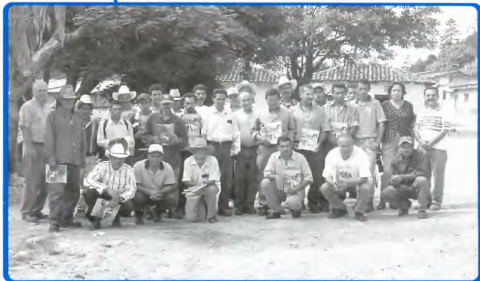
Productores y extencionistas de la zona de Vallecillo, Francisco Morazán.

Se anunciará durante el mes de septiembre en los periódicos locales, el lugar y la hora de inicio de cada evento. Se cobrará una mínima cuota para cubrir algunos gastos del evento y materiales. El cupo será limitado a 50 personas en cada sitio. Para pre-inscribirse pueda llamar a: PROMIPAC-Zamorano, El Salvador, teléfono 263-1253; y a PROMIPAC-Zamorano, Nicaragua teléfono 505-713-3100. En Zamorano nuestro teléfono es 504-776-6248.