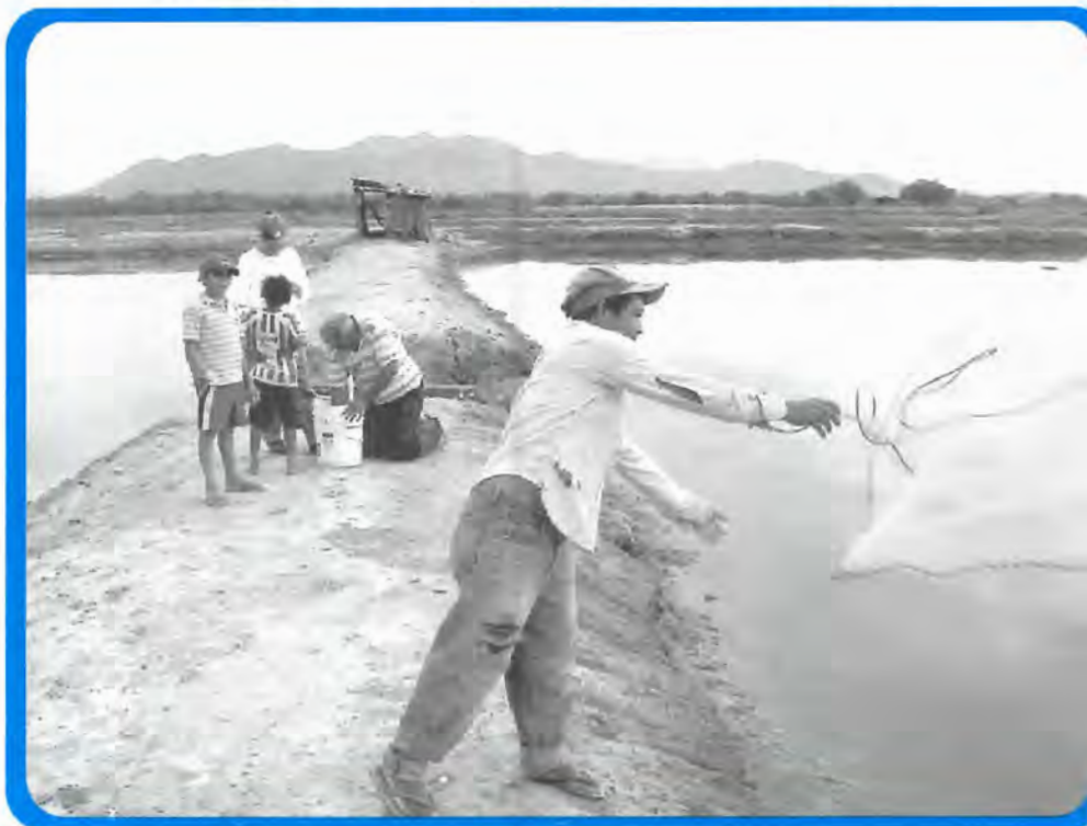
Productores haciendo muestreo de crecimiento de camarón.

La alianza resultó en un trabajo cooperativo generando un inventario de productores de camarón en el sur de Honduras. Hemos entrevistado aproximadamente 162 productores de los estimados 250 en fincas camaroneras en Honduras. El inventario constituye una base importante de información para elaborar planes de acción en apoyo al sector.