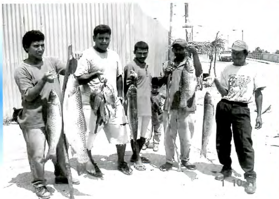
Pescadores artesanales vendiendo Tilapias y Carpas de diferentes especies. El Progreso, Yoro.