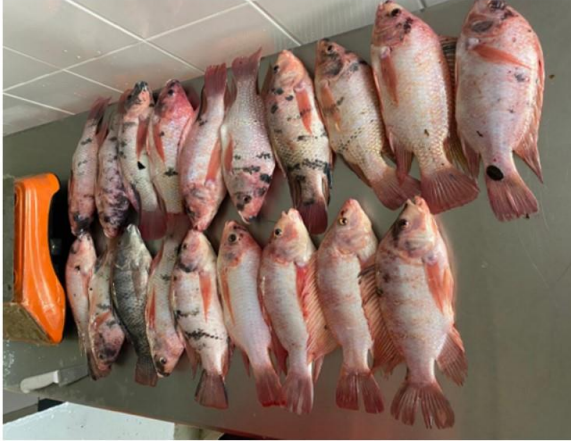
Evaluación de Rendimiento de las Visceras