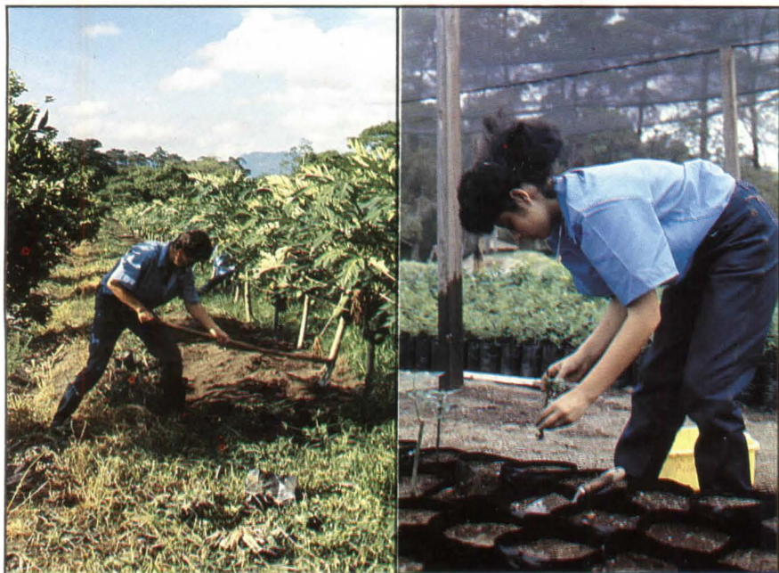
El trabajo de campo es igual para estudiantes de ambos sexos

El graduado adquiere conocimientos, destrezas y actitudes tales como las siguientes: