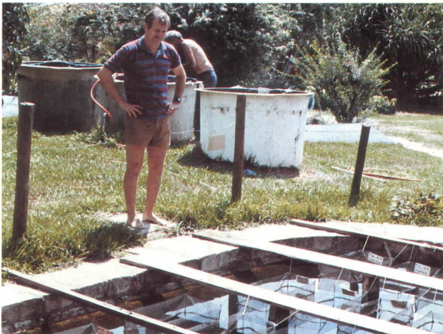
Acuicultura realiza investigación y ofrece asistencia técnica

Reforestación del cerro Las Tablas en el monte Uyuca, con 20,000 Pinus oocarpa , plantados por soldados y por niños y jóvenes de la aldea Joya Grande.