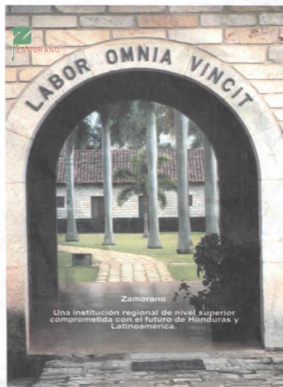
Este es uno de los posters diseñados en el Centro de Comunicación para promocionar nuestra institución.

El Centro de Comunicación apoya, primordialmente, las actividades académicas de Zamorano a través de la producción de materiales educativos, asesoría en cursos de comunicación para los estudiantes, capacitación en uso de medios para docentes e instructores, apoyo a las tesis de estudiantes y las actividades extracurriculares como el Club de radio y otros en formación.