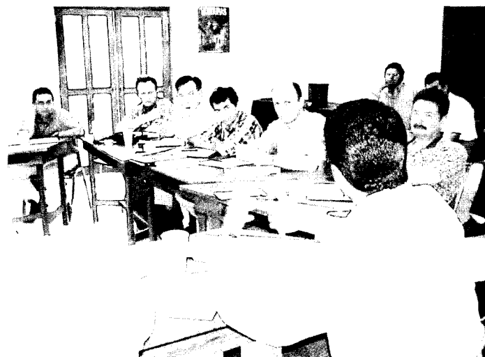
Recientemente los miembros del equipo de PROMIPAC de los tres países, se reunieron en Zamorano para revisar sus logros y planificar las actividades futuras.

El programa se ejecuta en Nicaragua, El Salvador y en Zamorano, y su estrategia es involucrar a las instituciones que trabajan en la zona (ONG, instituciones gubernamentales e institutos técnicos) a través de la capacitación de capacitadores. Actualmente se trabaja con 35 entidades en los tres países, las cuales a su vez capacitan estudiantes y extensionistas, hacen investigación y proveen servicios de capacitación e información a los productores.