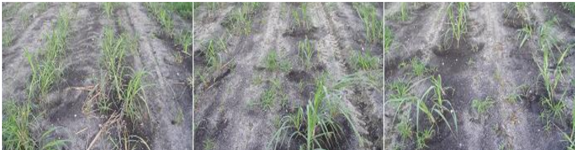
Anexo 3. Aplicación del tratamiento mesotrione + 2,4-D + ametrina