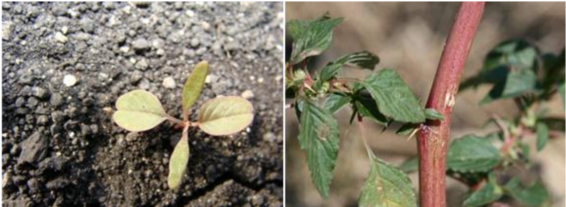
Figura 2. Amaranthus spinosus ; izquierda, emergiendo del suelo; su altura es de aproximadamente 1 - 2 cm. Derecha, es una planta madura, puede alcanzar una altura 1.0 m y en ocasiones hasta 1.8 m.

Ambrosia artemisiifolia . Es una planta anual, erecta, tiene tallos ramificados y sus hojas son alternas. Las flores masculinas tienen la apariencia de una copa invertida. Las flores femeninas están en racimos en las axilas de las hojas superiores. Se reproduce por semillas y se puede encontrar en todos los hábitats (Figura 5) (Odero 2012).