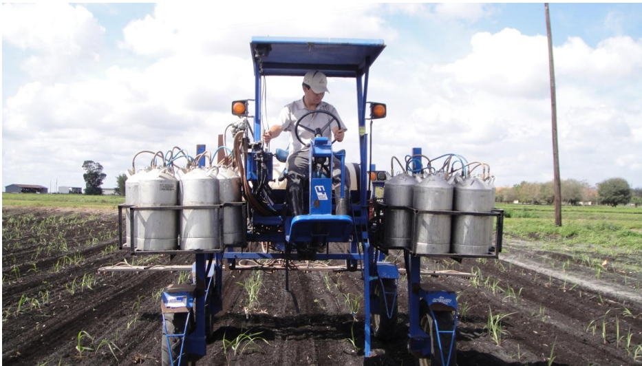
Figura 7. Uso de Lee Spider Sprayer para la aplicación de los herbicidas.

Lee Spider Sprayer se calibró para liberar 190 L/ha a 40 PSI. Se usaron 4.4 L por tanque para las tres parcelas aplicadas por tratamiento. Se utilizaron boquillas 8003, abanico plano, esto quiere decir que el ángulo de abertura fue 80° y la descarga fue de 0.3 gpm; cada boquilla estaba distanciada una a otra a 20 cm.