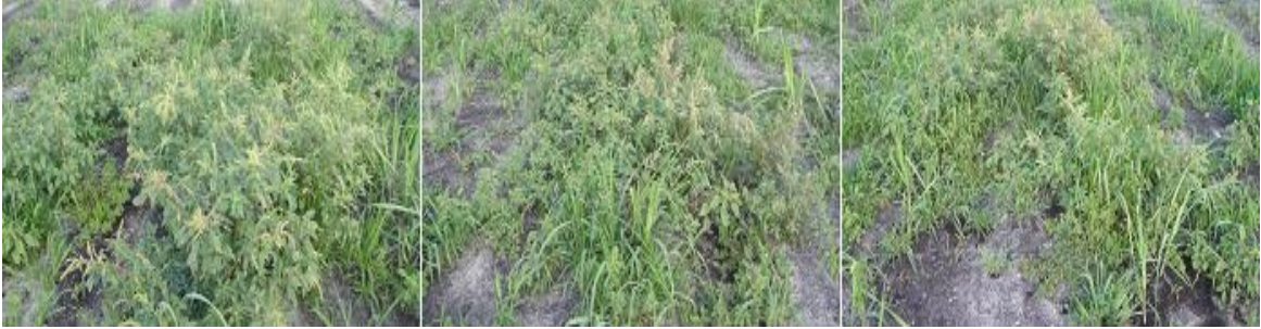
Anexo 8. Testigos sin aplicación de herbicidas.