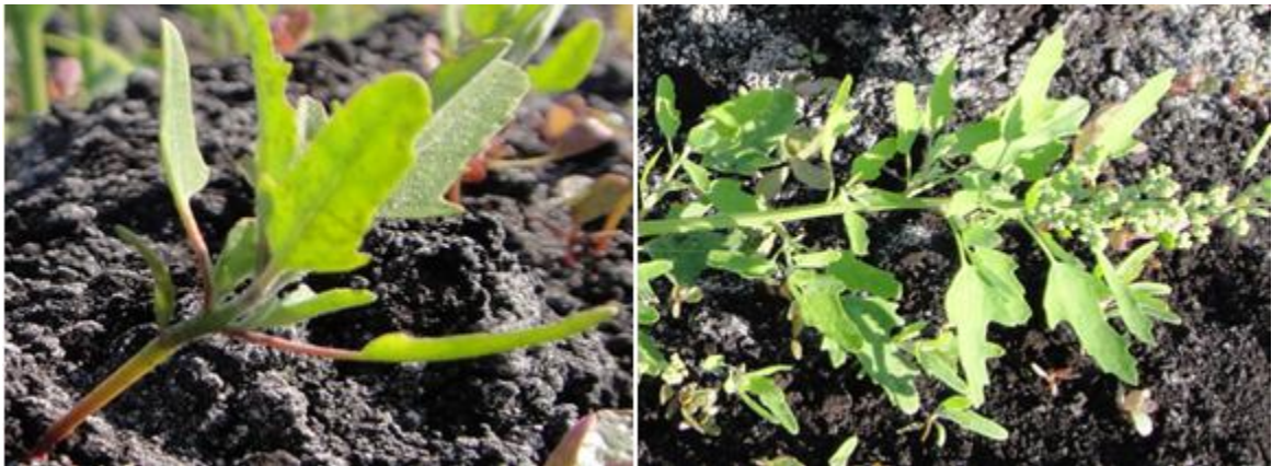
Figura 3. Chenopodium album ; izquierda, tiene una altura entre 6 - 8 cm. Derecha, es una planta madura que puede alcanzar alturas entre 1.0 – 1.8 m.