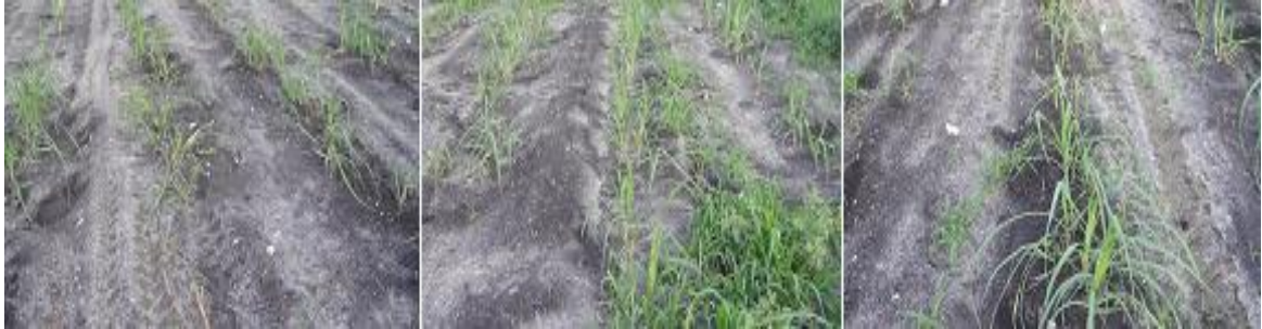
Anexo 1. Aplicación del tratamiento mesotrione + atrazina + ametrina.