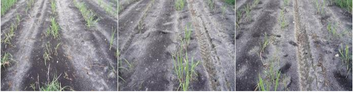
Anexo 4. Aplicación del tratamiento mesotrione + 2,4-D + trifloxysulfuron sodio.