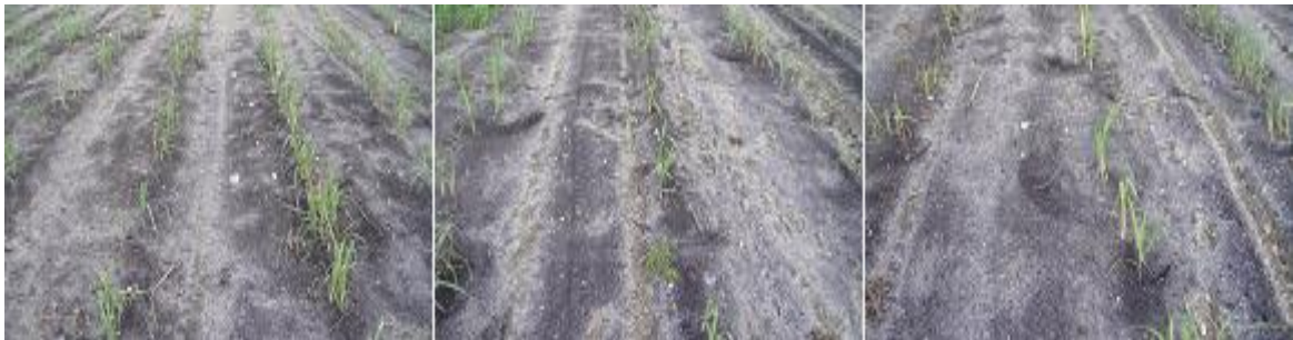
Anexo 2. Aplicación del tratamiento mesotrione + atrazina + trifloxysulfuron sodio