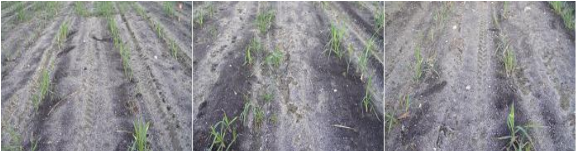
Anexo 5 Aplicación del tratamiento mesotrione + atrazina + ametrina + trifloxysulfuron sodio.