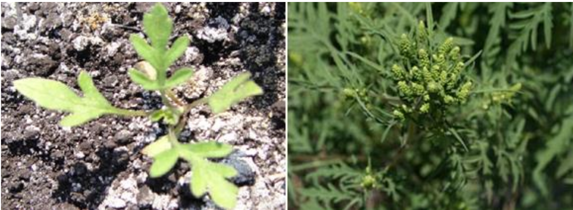
Figura 5. Ambrosia artemisiifolia , izquierda tiene una altura de 3 – 5 cm. Derecha puede llegar hasta una altura de 1.8 m. Fuente: Otero 2012.

Área. El tamaño de cada parcela fue de 6.10 m de ancho por 9.14 m de largo, un área por parcela de 55.74 m 2 y un total de 1,337.8 m 2 en las 24 parcelas. Se establecieron tres repeticiones por tratamiento en bloques completamente al azar (Figura 6).