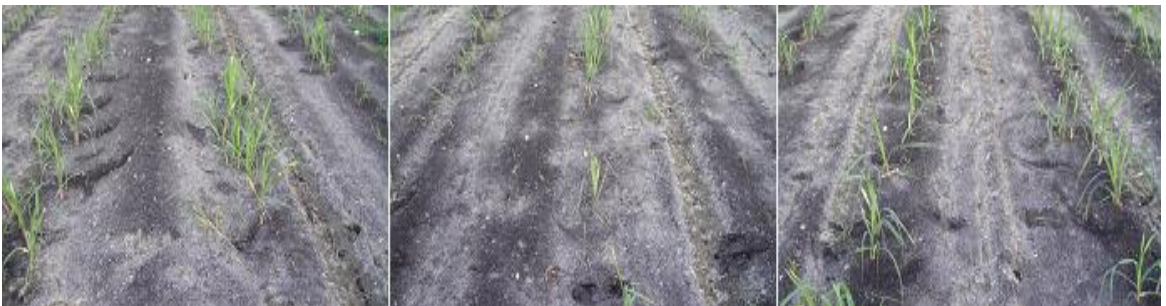
Anexo 7. Aplicación del tratamiento atrazina + 2.4-D + ametrina + trifloxysulfuron.