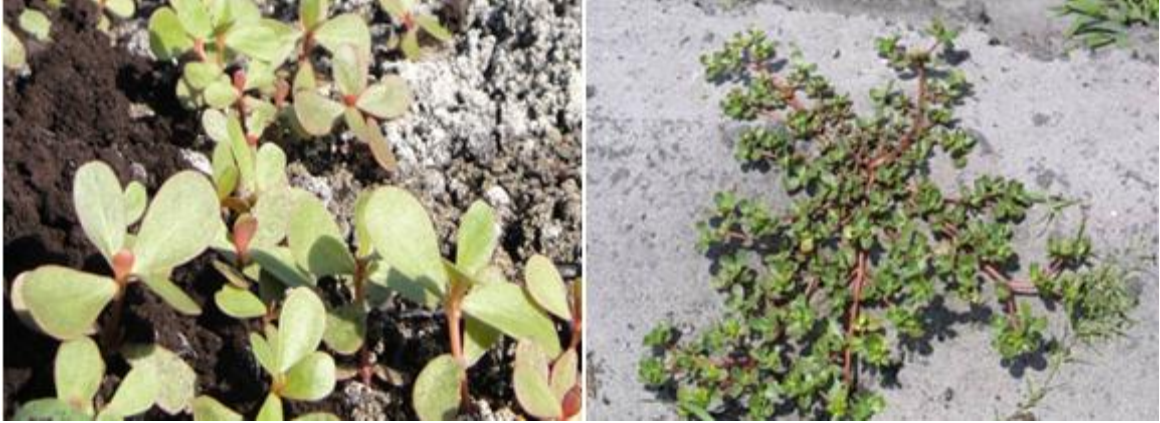
Figura 4. Portulaca oleracea ; izquierda, está emergiendo del suelo con altura de 0.5 – 2.0 cm. Derecha, planta madura, rastrera y puede alcanzar una altura de 30 – 40 cm.