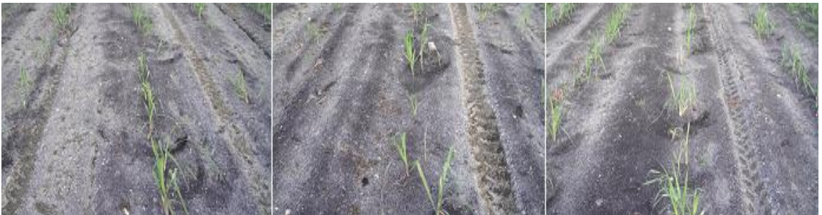
Anexo 6. Aplicación del tratamiento mesotrione + 2,4-D + ametrina + trifloxysulfuron sodio.