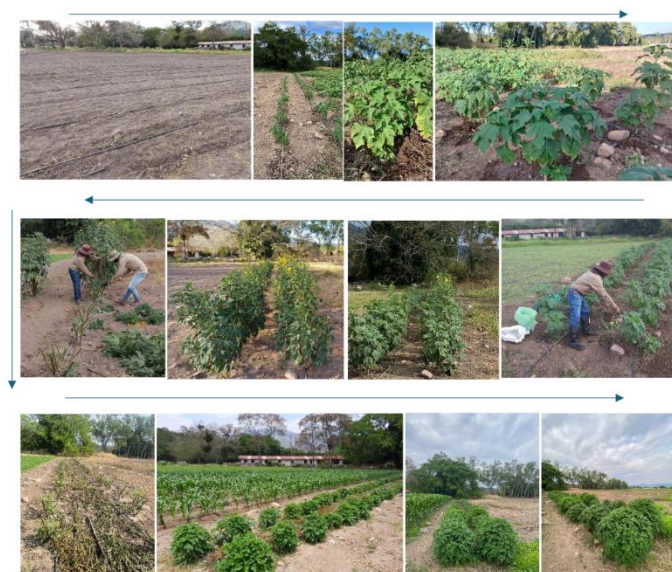
Diagrama del proceso de establecimiento del Tithonia diversifolia en la etapa de campo con su respectivo manejo.