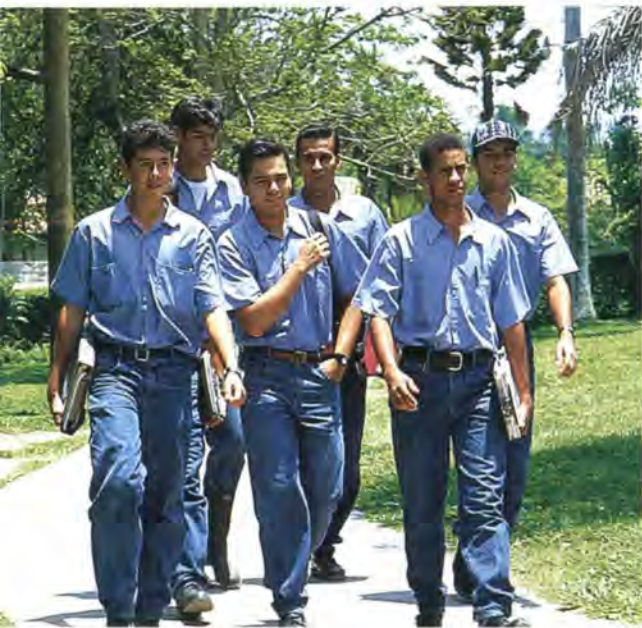
Las amistades hechas en Zamorano son para toda la vida. Friendships formed at Zamorano last a lifetime.

cia académica y el desarrollo del carácter hace que los estudiantes desarrollen hábitos de estudios sólidos y saludables, así como también buenos hábitos de conducta personal y laboral. Los estudiantes incapaces de desenvolverse en un ambiente con los altos estándares de Zamorano deben terminar sus estudios en otra universidad.