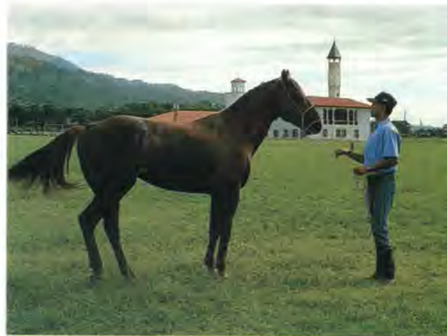
El Club Ecuestre es una de varias opciones que tienen los alumnos para invertir su tiempo después del trabajo de campo y clases.

As always, athletics represented an important extracurricular activity. Students jog, lift weights, swim and participate in aerobics and informal team competitions. Zamorano's official soccer, softball, basketball and volleyball teams continue to be competitive against teams from other universities and institutions in Honduras.