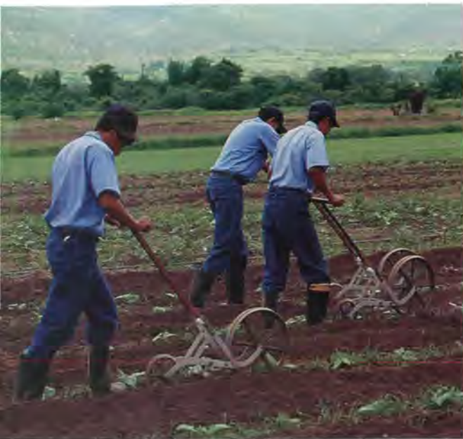
Los estudiantes aprenden el valor del trabajo duro .... Students learn the value of hard work...

una multitud de retos físicos, intelectuales y emocionales. Su vida diaria es guiada por un código de conducta que requiere honestidad, independencia, respeto a los demás, trabajo duro, organización, productividad y puntualidad. Este reglamento delinea un riguroso horario diario y un patrón de conducta que prohíbe estrictamente la copia, el robo y el consumo de alcohol y drogas en el campus. Los estudiantes deben presentarse puntualmente a sus clases, mantener limpios sus cuartos y su apariencia personal y estar listos para la hora de silencio a las 9:00 de la noche en punto.