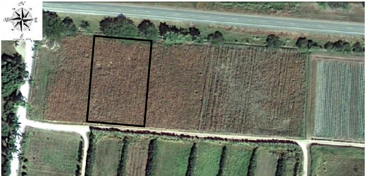
Figura 1. Mapa de Lote 0 sección de Olericultura en la Escuela Agrícola Panamericana (Zamorano), Honduras.

Ubicación de la zona de estudio. El estudio se realizó en Lote 0 (figura 1), en el área de Zona II de la Escuela Agrícola Panamericana, Zamorano, Honduras. El sitio está a 800 msnm y cuenta con una precipitación promedio anual de 1100 mm, distribuidos de mayo a octubre y una temperatura promedio de 24 °C. Suelos son franco limosos sobre franco arcillosos, con presencia de pedregocidad y problemas con la infiltración de agua. Contienen 1.5% de M.O. un pH entre 5.5 – 6.5. Se realizó de Enero a finales de Septiembre.