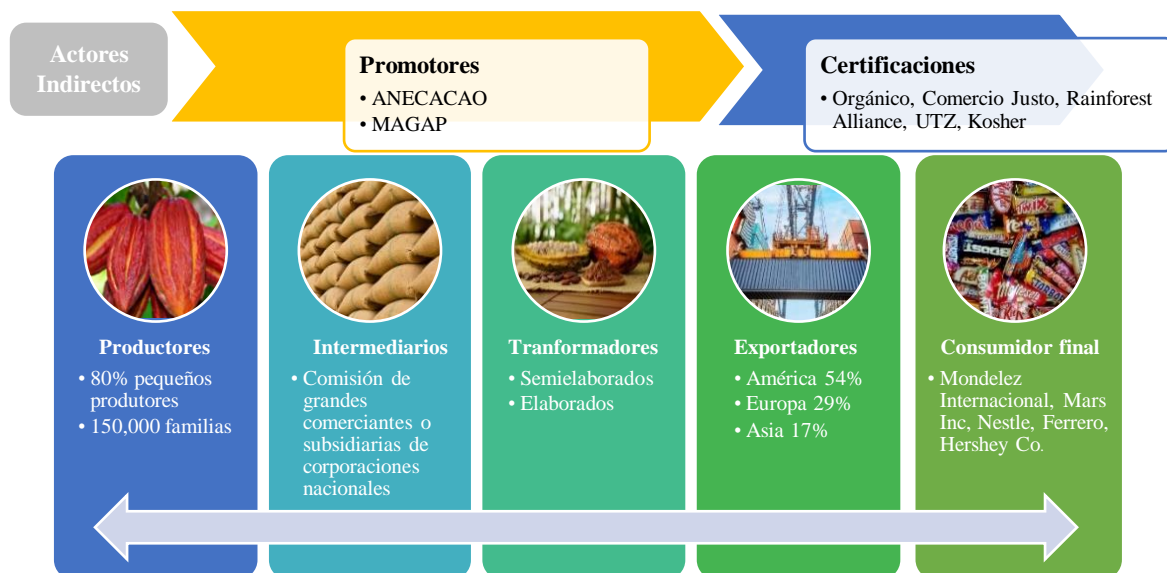
Figura 1. Cadena de cacao en Ecuador

Intermediarios. Después de la cosecha y tener listo para la venta, están los intermediarios que son quienes negocian precios y calidad para el cliente. De acuerdo a Acebo, el comercio local de cacao involucra un gran número de intermediarios, que por lo general trabajan con comisión para grandes comerciantes o subsidiarias de corporaciones nacionales (Acebo Plaza, 2016). Es importante mencionar que hay varios tipos de intermediarios en esta cadena, los que se ubican en las zonas de producción y los otros que recorren todas las zonas. Aproximadamente hay que por lo menos hay dos intermediarios entre agricultor y exportador, los pequeños intermediarios y los mayoristas. Los pequeños intermediarios tienen negocios directos con los agricultores y por otro lado los mayoristas revenden a los exportadores (Diario La Hora 2015).