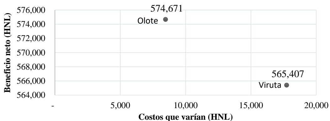
Figura 1. Beneficios netos y costos que varían para dos distintos tipos de cama en el escenario 1, donde el olote es cercano y gratis (8 km de radio desde galpón), y costo de obtención para la viruta.

La dominancia en el presupuesto parcial hace referencia a los costos que varían y sus beneficios netos entre los distintos tratamientos. En el presente estudio se observó dominancia de los distintos tipos de materiales de cama para cada escenario. Los diferentes escenarios con los materiales de cama dominados son observados en las Figuras 1, 2, 3 y 4.