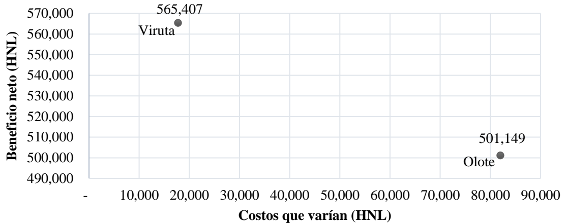
Figura 4. Beneficios netos y costos que varían para dos distintos tipos de cama en el escenario 3, donde el olote es lejano (317 km de distancia del galpón) y con costo por kilogramo de material.

En el cuarto y último escenario, el olote se encuentra lejano (165 km de distancia del galpón) y con costo por kilogramo de material. Como indica la Figura 4, el olote se presenta como el material dominado, debido a que la viruta presenta un mayor beneficio neto y menor costos que varían, al compararlo con el olote. El avicultor debe escoger el tipo de material de cama de viruta, cuando el material de cama de olote se encuentra lejano y con costo por kilogramo de material (317 km de distancia del galpón).