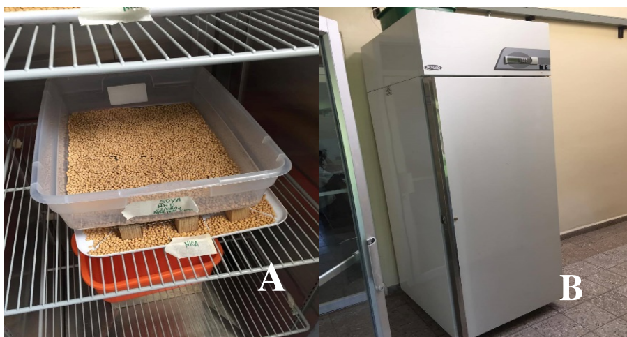
Figura 1. Semillas colocadas en cajas plásticas (A), cámara de prueba de estabilidad de humedad y temperatura (B) en el laboratorio de análisis de alimentos de la Escuela Agrícola Panamericana, Zamorano.

Determinación del vigor de las semillas. Se utilizó la variedad de soya FHIA-15 (Fundación Hondureña de Investigación Agrícola). Previamente se realizó un análisis de germinación y uno de vigor en el laboratorio de semillas de la Escuela Agrícola Panamericana, la cual dio como resultado un 94% y 91% respectivamente. Este análisis se hizo para conocer la calidad de la semilla a la que se iba a someter al tratamiento. El tratamiento contó de una prueba de envejecimiento acelerado la cual es una estimación de la longevidad de la semilla en el almacén, exponiendo a las semillas a un estrés térmico que provoca un deterioro en ella. Las semillas seleccionadas se colocaron en cajas de plástico (Figura 2A), luego se colocaron en una cámara de prueba de estabilidad de humedad y temperatura (Figura 2B) en el laboratorio de análisis de alimentos de la Escuela Agrícola Panamericana, la cual se estabilizó a una temperatura de 41 °C y una humedad superior al 90% durante 64 horas.