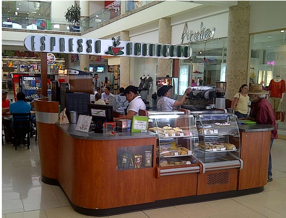
Anexo 7. Vista frontal de un local de destino.