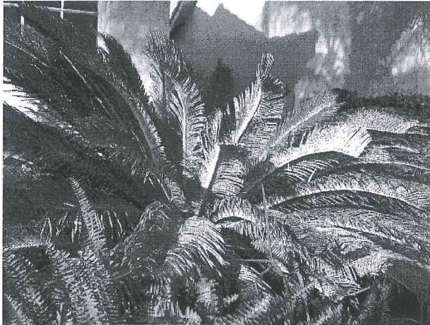
Figura 1. Cycas revoluta infestada con la escama Aulacaspis yasumatsui en Florida.

El conocimiento de la biología, desempeño y ecología del agente potencial de control biológico es de suma importancia para desarrollar estrategias para el manejo de plagas y poder obtener un control eficaz. El impacto de factores ambientales como la temperatura y la humedad son de suma importancia en la biología de las plagas y de sus enemigos naturales (Skirvin y Fenlon 2003). La biología y capacidad depredadora de Phaenochilus n. sp son desconocidas hasta ahora. Por lo tanto, el objetivo general de este estudio fue evaluar el desarrollo y comportamiento de Phaenochilus n. sp. a cuatro temperaturas como agente de control biológico de la escama A. yasumatsui en condiciones de laboratorio en Florida. Los objetivos específicos fueron: evaluar el ciclo de vida, tiempo de desarrollo, y sobrevivencia de Phaenochilus n. sp. alimentado con A. yasumatsui a cuatro temperaturas constantes y determinar la tasa de consumo por Phaenochilus n. sp. alimentado con A. yasumatsui a cuatro temperaturas constantes.