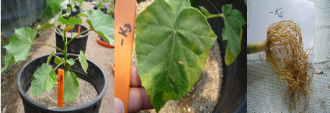
Figura 4. Planta de Jatropha curcas 47 días después de siembra con síntomas de deficiencia de Potasio (-K). Zamorano, Honduras.