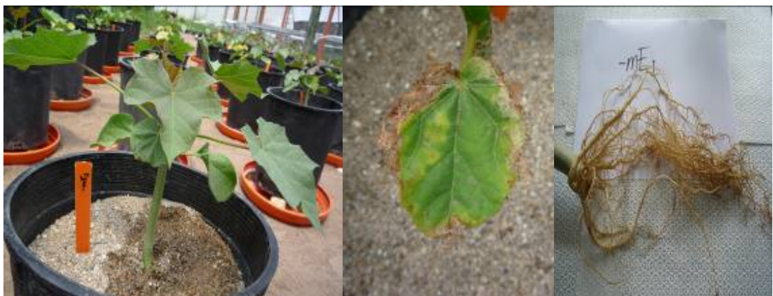
Figura 6. Planta de Jatropha curcas 47 días después de siembra con síntomas de deficiencia de microelementos (-Me). Zamorano, Honduras.