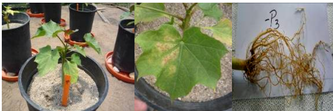
Figura 3. Planta de Jatropha curcas 47 días después de siembra con síntomas de deficiencia de Fósforo (-P). Zamorano, Honduras.