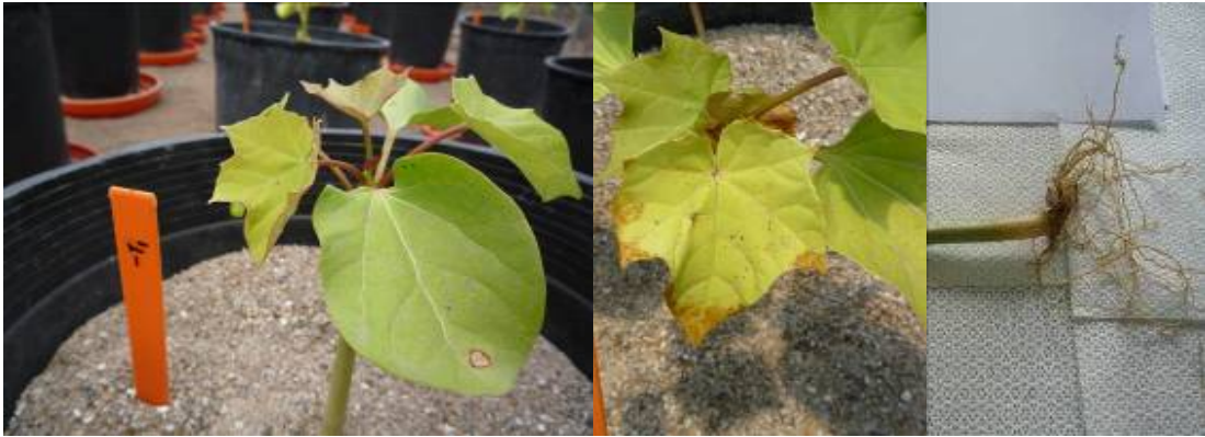
Figura 7. Planta de Jatropha curcas 47 días después de siembra sin aplicación de nutrientes (-T). Zamorano, Honduras.