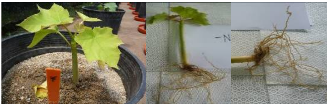
Figura 2. Planta de Jatropha curcas 47 días después de siembra con síntomas de deficiencia de Nitrógeno (-N). Zamorano, Honduras.