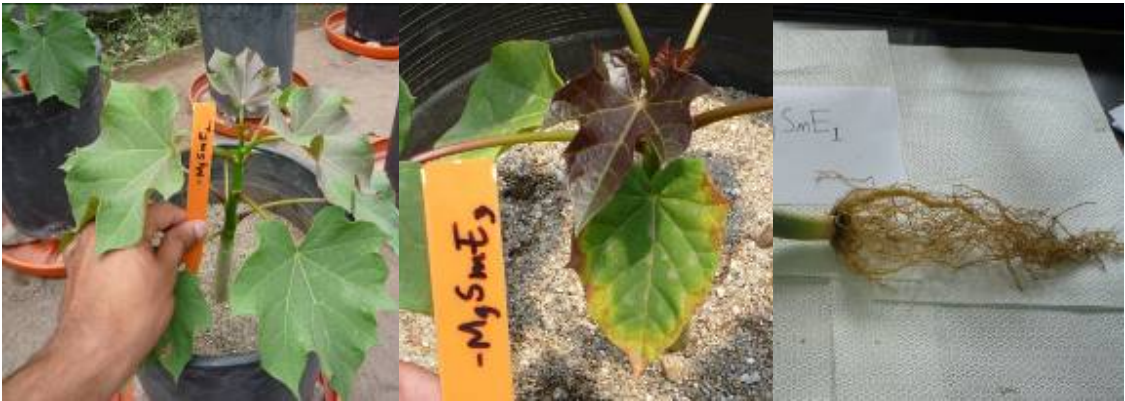
Figura 5. Planta de Jatropha curcas 47 días después de siembra con síntomas de deficiencia de Magnesio Azufre y microelementos (-Mg S Me ). Zamorano, Honduras.