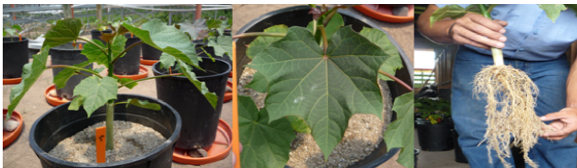
Figura 1. Aspecto de planta de Jatropha curcas 47 días después de siembra con aplicación de todos los nutrientes (+T). Zamorano, Honduras.