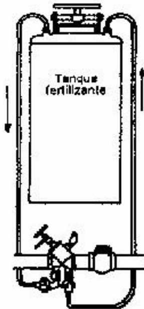
Figura 2. Tanque de almacenamiento y mezcla de fertilizantes.

La aplicación de los tratamientos se hizo a través de riego por goteo haciendo uso de un tanque con capacidad de 400 litros (Figura 2). Se aplicaron dos horas de riego en el área experimental previo a las aplicaciones de fertilizantes. Se hicieron tres aplicaciones de fertilizantes en las semanas 7, 15 y 22 después de trasplante con 1/3 de la dosis en cada una.