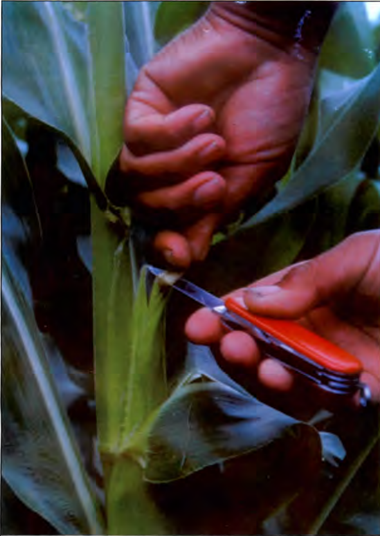
Fotografía 3. Corte de la barba del jilote. El corte debe hacerse con cuidado y con un cuchillo bien afilado.

Una vez embolsadas las cuchillas, hay que estar atentos al momento en que todas saquen la barba para cortar unos dos centímetros debajo de la punta.