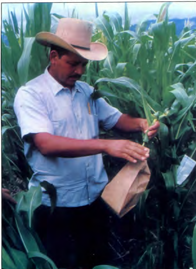
Fotografía 4. Recolección de polen. El polen se recoge solamente de las plantas seleccionadas y que usted considere que serán buenos padres.

a todas las plantas seleccionadas. La desventaja de recoger el polen de esta manera es que permite que caiga polen de otras plantas en la flor de las matas que seleccionamos y tendremos algunas mezclas indeseables en nuestra próxima semilla por lo que hay que tener mucho cuidado de mantener la bolsa con polen abierta.