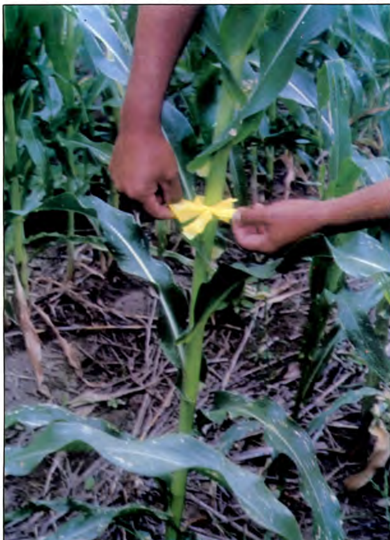
Fotografía 1. Identificación de plantas seleccionadas con un chongo de plástico amarillo. Seleccione las mejores plantas de su milpa.

Una vez que esté sembrada la milpa, ya sea de la variedad criolla pura o mezclada, habrá que escoger dentro de ella el mayor número de plantas que se parezcan a nuestra planta ideal.