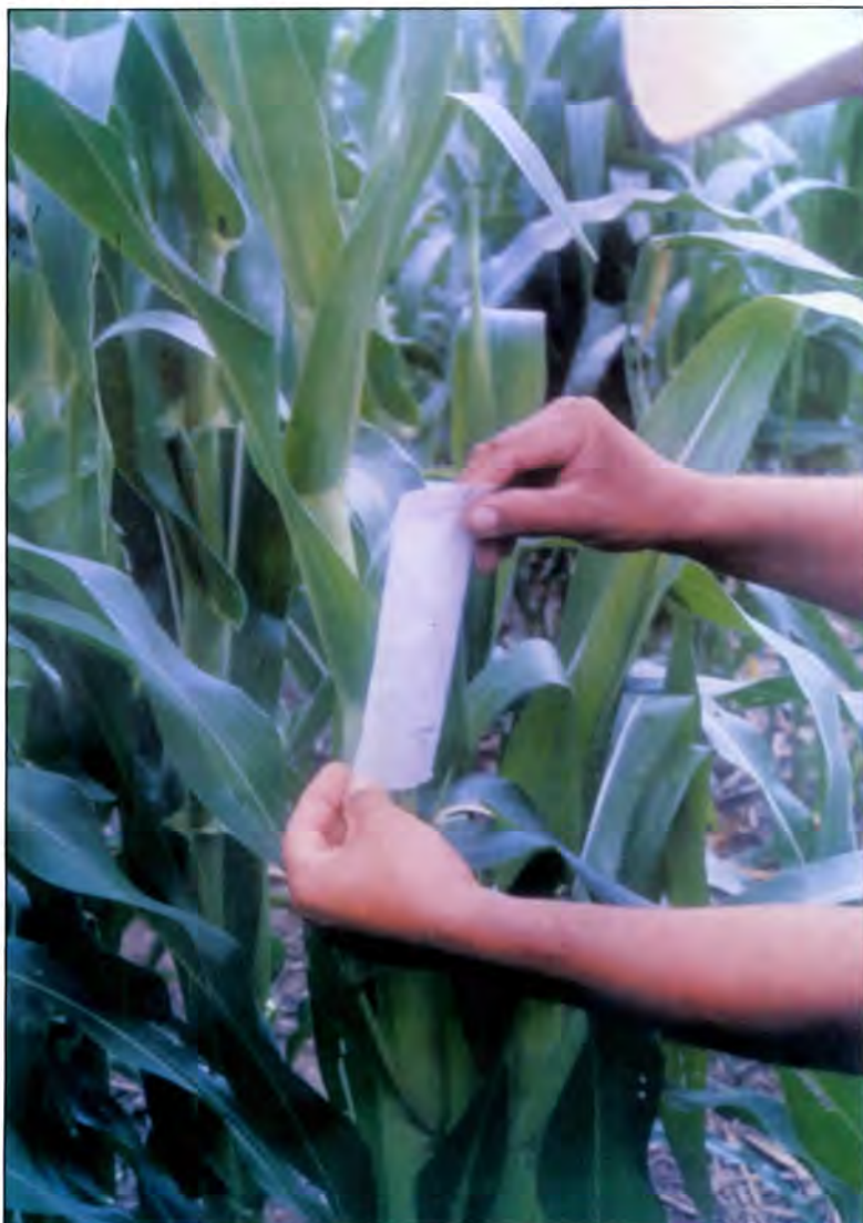
Fotografía 2. Colocación de la bolsa para el control de la polinización.

El control de la polinización se hace para evitar que las buenas plantas que seleccionamos sean polinizadas por plantas que no queremos que sean los padres de la semilla mejorada.