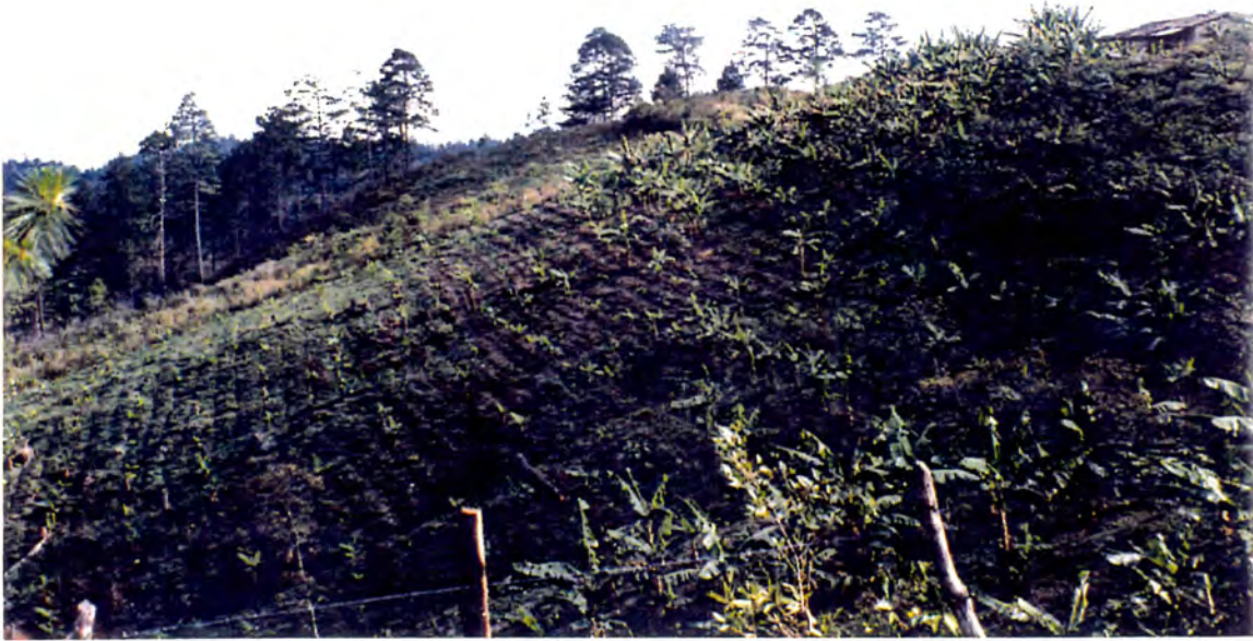
Explotación en zona de bosque húmedo subtropical en El Limón, San Antonio de Oriente (1300 msnm).