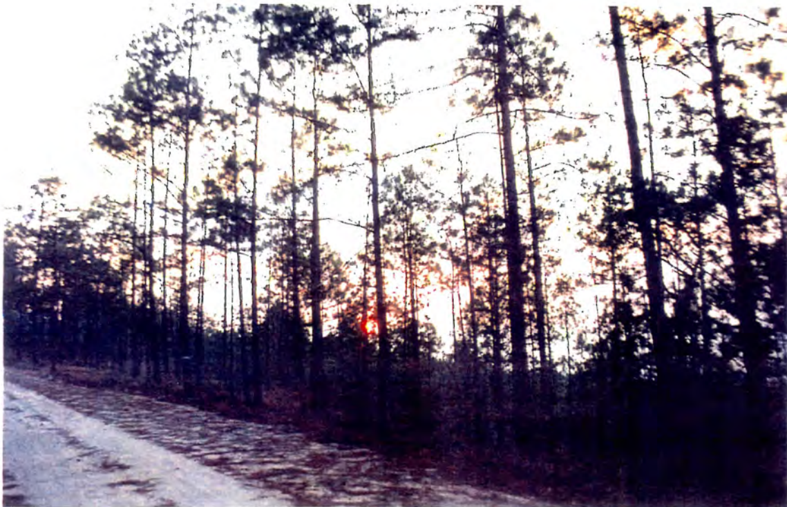
Bosques dedicados al aprovechamiento de resina en Yuscarán