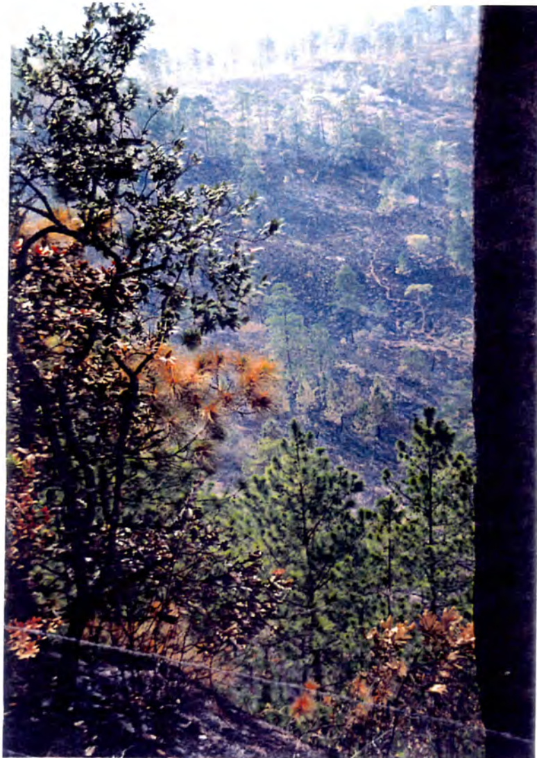
Efectos de incendios en la región (Guinope 5,97)