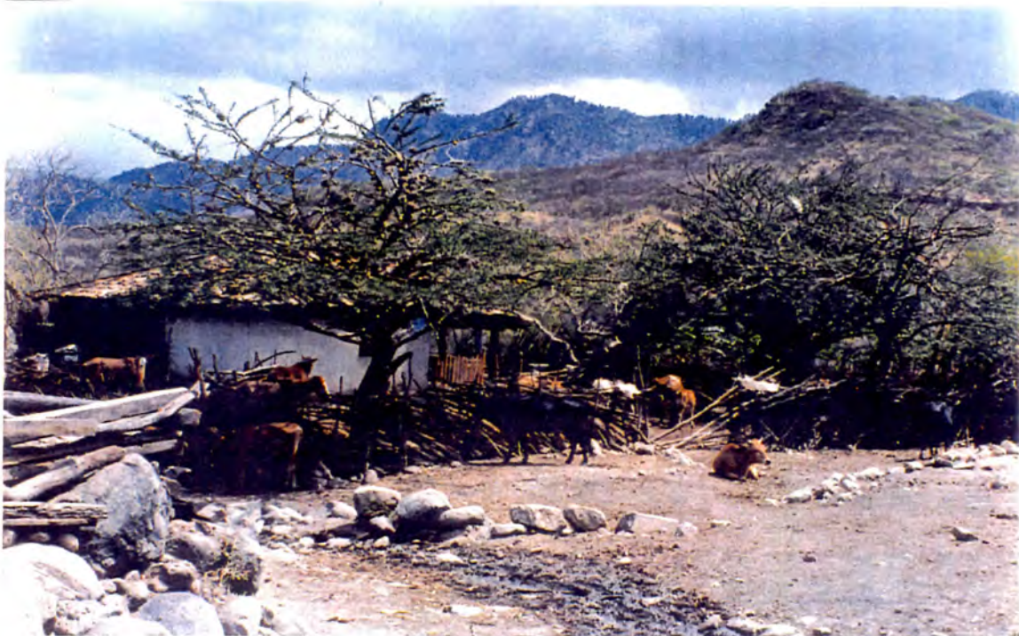
Explotación en zona de bosque seco en terreno de San Pedro, Maraita (500 msnm).