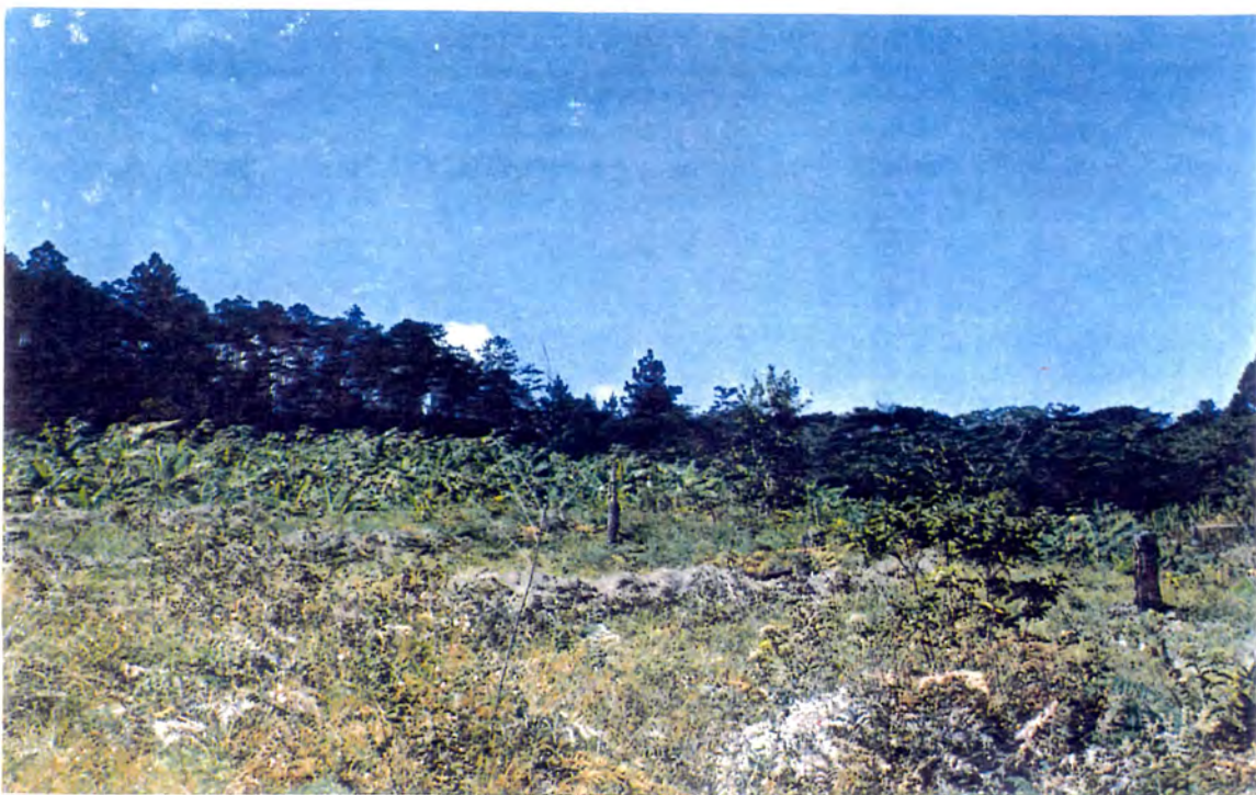
PREDIO ABANDONADO POR BAJA FERTILIDAD DEL SUELO, LISTO PARA INICIAR EL CICLO DE BARBECHO (DESCANSO DE LA TIERRA). MUNICIPIO DE SAN ANTONIO DE ORIENTE.