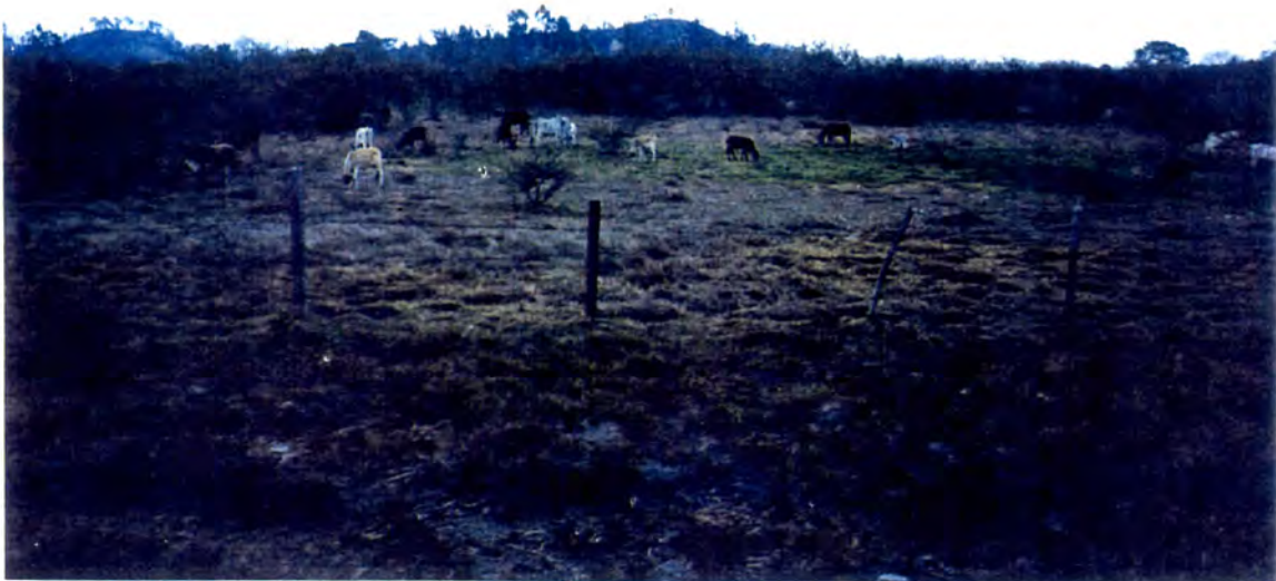
TERRENO CON EFECTO DE SOBRE-PASTOREO EN LA PARTE ALTA DE LA ALDEA DE LAS MESAS, SAN ANTONIO DE ORIENTE.