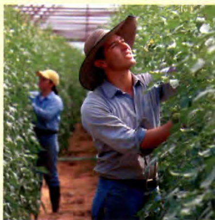
La producción agrícola

Las Empresas Universitarias de Zamorano están organizadas en cadenas de valor y servicios que permiten a los estudiantes desarrollar sus habilidades técnicas, adquirir conocimientos y establecer normas con una visión empresarial integral y globalizada