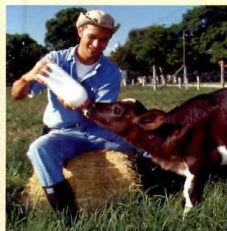
La producción pecuaria