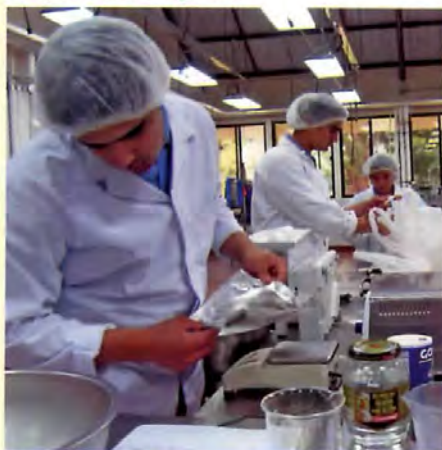
Las plantas de procesamiento