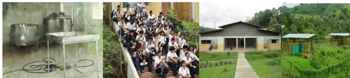
Cuadro 3. Resumen de los proyectos educativos de la Fundación JJCZ en la comunidad de Limoncito.