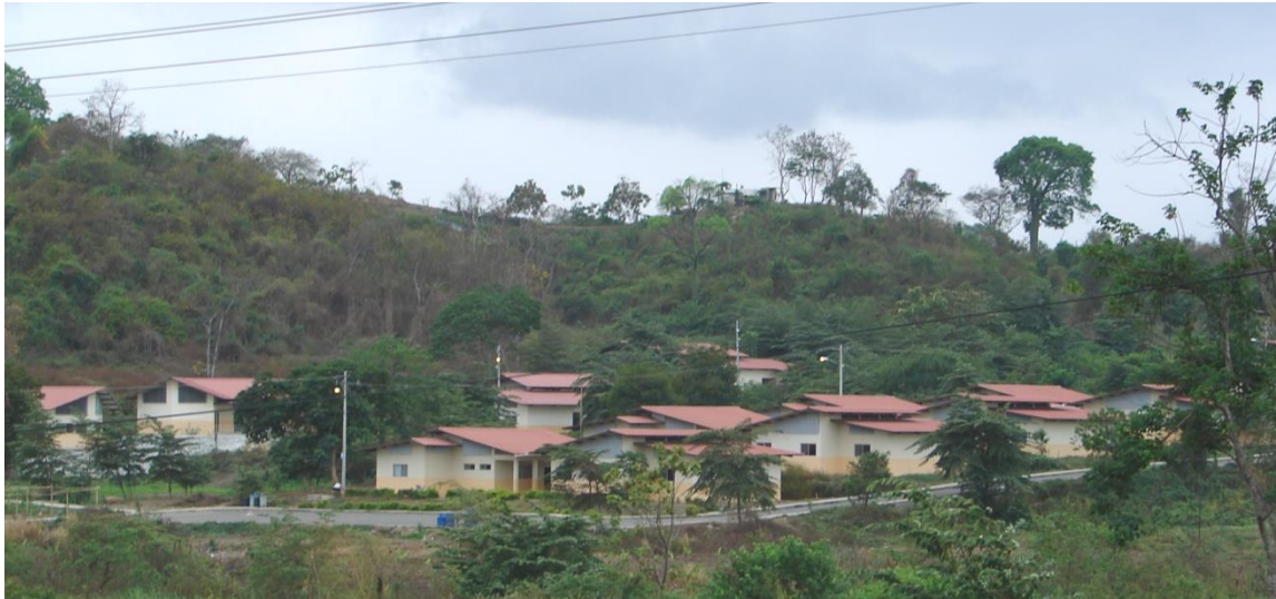
Figura 5. Complejo educativo de la UEM JJCZ en la comunidad el Limoncito © Felipe Vasquez, 2013.

Proceso de intervención. Para este estudio las iniciativas ejecutadas por la FJJCZ fueron divididas en proyectos de educación y proyectos productivos. De esta manera se definen como proyectos educativos al conjunto de actividades que buscan fortalecer la formación integral de los alumnos y los comuneros, en su relación directa con el aprendizaje, el medio social, el trabajo comunitario y participativo. Los proyectos educativos se complementan con los módulos de Aprender-Haciendo que sirve para integrar los conocimientos adquiridos en clases con actividades de campo para lograr la participación, la toma de decisiones, resolución de problemas proyectados a la comunidad (Cuadro 3).