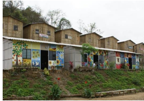
Figura 3. Construcción de aulas educativas con mano de obra de la comunidad el Limoncito © FJJCZ, 2008.

El Ministerio de Educación en el año 2009 hace entrega de las instalaciones correspondientes al área administrativa de la UEM (Figura 4). En estas se adecuaron cinco aulas de clase y el laboratorio de computación.