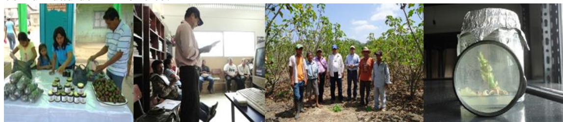
Cuadro 4. Resumen de los proyectos productivos de la FJJCZ implementados en la comunidad del Limoncito.

más grandes en términos de alcances y población meta como el proyecto de ciruela y la planta de agua potable. Estos proyectos juegan un papel relevante en los procesos de crecimiento y cambios estructurales en el territorio. A estos sistemas se les atribuye la capacidad de impulsar la formación y por lo tanto los rendimientos crecientes y el desarrollo económico (Cuadro 4).