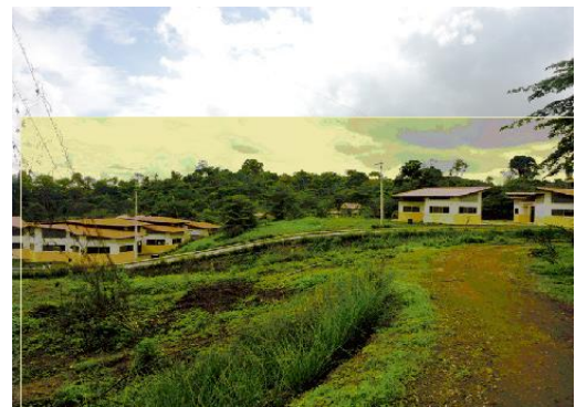
Instalaciones de la UEM JJCZ.