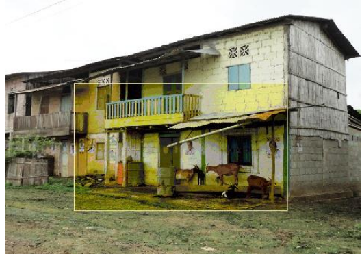
Producción de chivos.