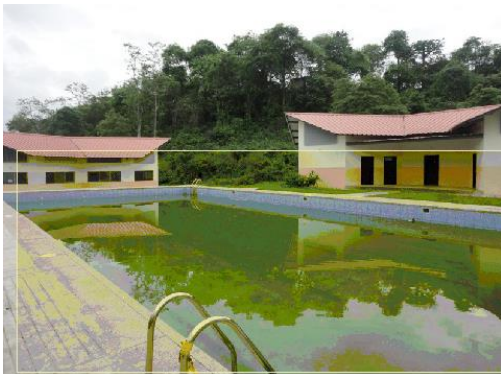
Estado actual de la piscina de la UEM.