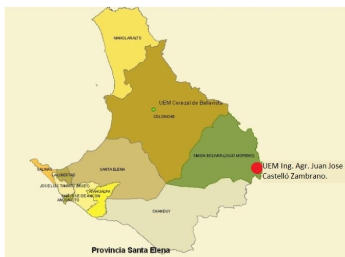
Figura 1. Ubicación geográfica de la UEM JJCZ en la provincia de Santa Elena, Ecuador © FJJCZ, 2013.

La agricultura es la principal actividad de la zona. La mayoría de la población se dedica a la agricultura de subsistencia a pesar de la existencia del trasvase Chongón-San Vicente que pasa por esta zona. El trasvase fue diseñado para transportar agua desde la Provincia de Santa Elena hasta la Provincia de Manabí. A futuro se espera que con este proyecto se pueda proveer de agua potable y de riego a las poblaciones de Balsas, Colonche, Corozo, Juntas, Julio Moreno Manglaralto, Sube y Baja, Icera, y las comunas desde Ayangué hasta la entrada, en el cantón Santa Elena, provincia de Santa Elena.