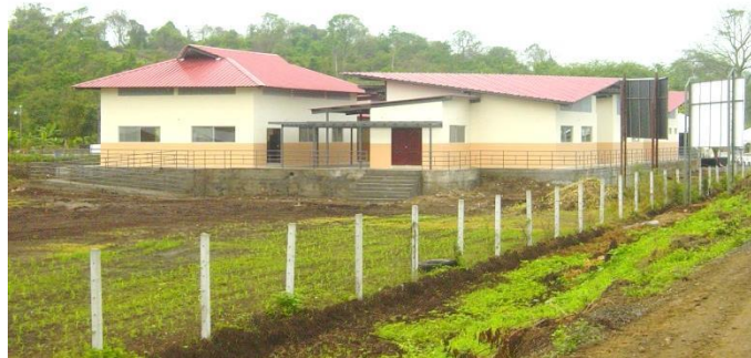
Figura 4. Instalaciones educativas en la primera fase de la UEM JJCZ en la comunidad el Limoncito © JJCZ, 2009.

El Ministerio de Educación en el año 2009 hace entrega de las instalaciones correspondientes al área administrativa de la UEM (Figura 4). En estas se adecuaron cinco aulas de clase y el laboratorio de computación.