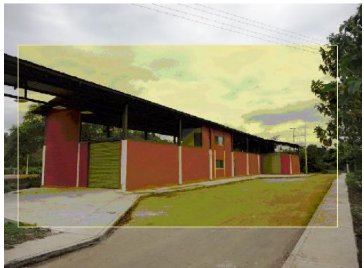
Instalaciones exteriores de la Planta de procesamiento de Ciruela.