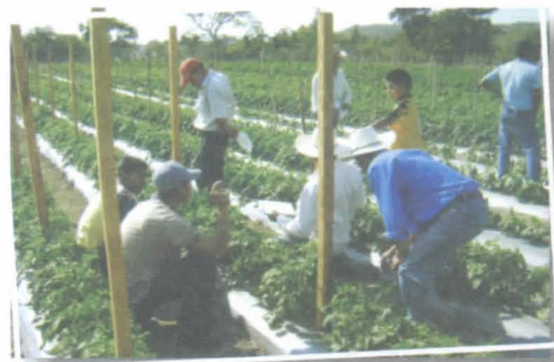
Foto 21. Actividad de recorrido de observación en la parcela.

Procedimiento. Se organizarán grupos, cada uno compuesto por un número máximo de cinco personas. Cada grupo realizará observaciones en el cultivo,