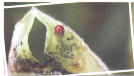
Foto 8. Mariquita depredando áfidos en una parcela ECA con agroecosistema estable.