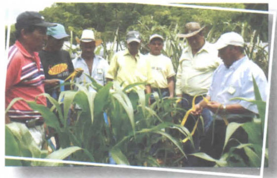
Foto 16. Agricultores discutiendo el estado fitosanitario del cultivo de maíz en la ECA.

Las dinámicas grupales son elementos primordiales e indispensables dentro del desarrollo de la capacitación ECA y se pueden utilizar con diferentes propósitos. Existen dinámicas para presentación, animación, para construcción de grupos, desarrollo de grupos y algunas como herramientas de facilitación y comunicación. Estas dinámicas se pueden aplicar durante las diferentes etapas de implementación de la capacitación de los productores.