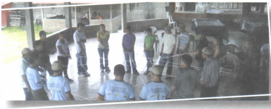
Foto 20. Ejemplo de dinámica de la telaraña.

Reflexión. Se reflexiona junto con los participantes a cerca de la importancia de la comunicación en todo trabajo en grupo.