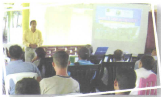
Foto 11. Sesión inicial para organizar una ECA con técnicos y agricultores.