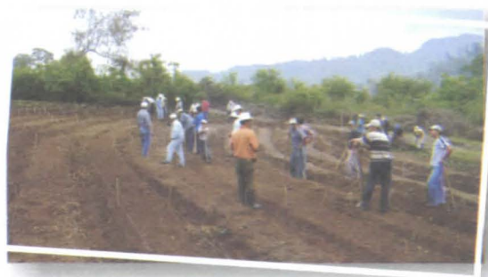
Foto 15. Productores elaborando diseño de parcela seleccionada para la ECA.

Algunas responsabilidades básicas de los grupos ECA son funcionar como grupo anfitrión en algunas sesiones, asegurar el buen manejo de los materiales y las herramientas que se estén usando y promover la responsabilidad grupal de las actividades asignadas como tareas desarrolladas entre semana.