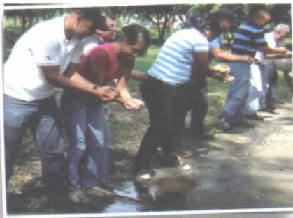
Foto 17. Técnicos realizando una dinámica de integración (vaso de agua) en la ECA.