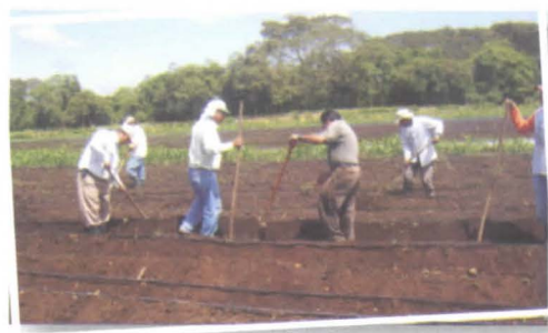
Foto 10. Participantes en la ECA implementando los conocimientos adquiridos en la preparación de suelo.