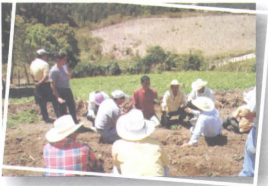
Foto 14. Agricultores en la ECA decidiendo el contenido de la currícula de capacitación.

La currícula de capacitación que se desarrolla en una ECA, es discutida y analizada con los participantes al principio del proceso. Lo anterior permite que el técnico y los productores se comprometan a manejar dicha currícula y ajustarla con sentido de responsabilidad. Lo normal es que esta currícula se base en el ciclo completo del cultivo y comprenda aspectos técnicos, manejo agronómico del cultivo y de postcosecha y defina principios sobre comercialización.