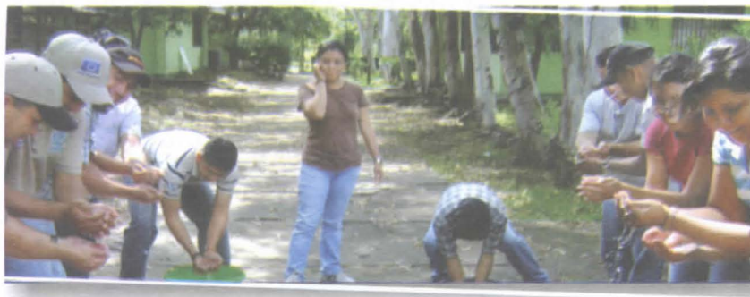
Foto 19. Grupo de técnicos realizando dinámica grupal pasando agua.