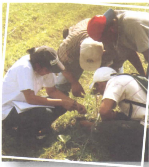
Foto 9. Técnicos haciendo AAE para conocer el comportamiento y la vida de las plagas.