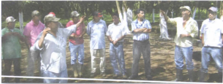
Foto 18. Técnicos realizando dinámica de presentación grupal en la ECA.